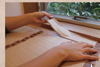
② カットしたタイルを貼る