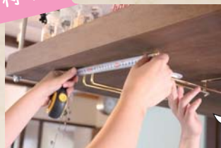
① 金具を付ける位置を測る