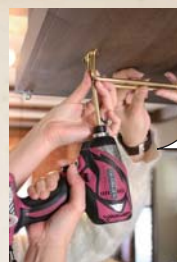
② 金具をビスで留める

インパクトドライバーで ビスを打ちます。 斜めに入らないように垂直に するのがポイント！ 力をぐっと押し込むと 入りやすいです。