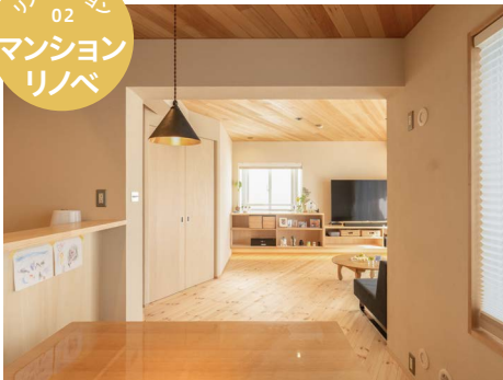
リノベーション 02 マンション リノベ