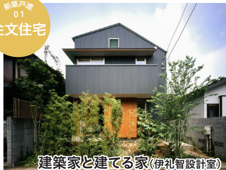
建築家と建てる家(伊礼智設計室)