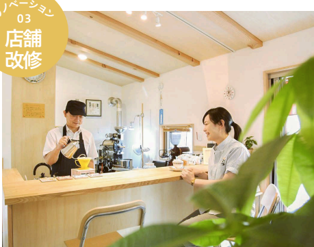
リノベーション 03 店舗 改修