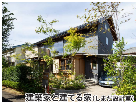
建築家と建てる家(しまだ設計室)