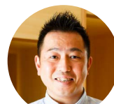
家づくりガイド 新 次郎