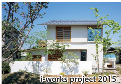
i-works project 2015

「つむじ」では伊礼智さん設計の「i-works project 2015」と小泉誠さんがインフィルデザインを担当した3階建てドミノ住宅の見学が可能です