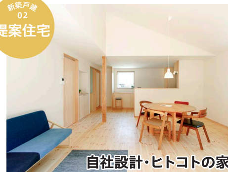
自社設計・ヒトコトの家