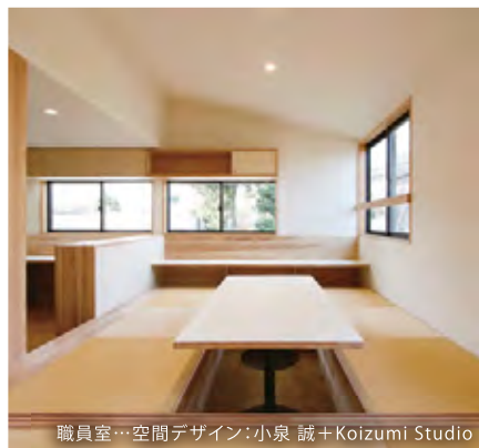
職員室…空間デザイン:小泉 誠+Koizumi Studio