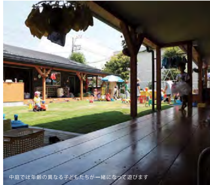
中庭では年齢の異なる子どもたちが一緒になって遊びます

0～5才児の子どもたちが自然に交流できるようにと、中庭をはさんで各年齢の教室が向かい合わせになるように設計された園舎。年上の子が何かに取り組んだり、助け合ったりする様子を年下の子が見て覚えたり、先生たちも担当クラス以外の子どもたちとの交流があることで、名前はもちろん、どんな子たちがいるのか把握でき、園全体で子どもたちを見守ることができるのです。ひとつの大きな屋根の下、大人も子どもも楽しそうに笑顔で過ごしている様子は、まるで大家族のようなあたたかさがありました。