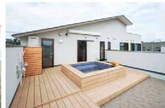
1. 掘りごたつで、くつろげる職員室。2. カウンターで外を眺めながらほっと一息。3. テラスにある露天風呂。延長保育の際に1日を振り返りながら入浴します。帰宅が遅くなくても、子どもも親もゆったり過ごせますね。