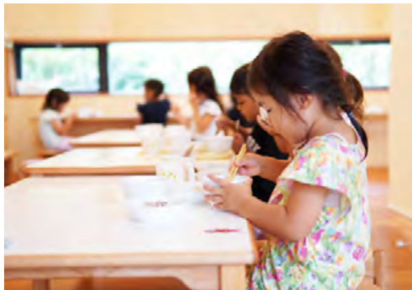
1. 園庭に面した縁台で、風を感じながら食べる給食は格別。2. ホール横のテラスでは、男の子グループが賑やかに食事をとっていました。3. ホールには、テーブルや掘りごたつだけでなく、窓に面したカウンター席もあります。