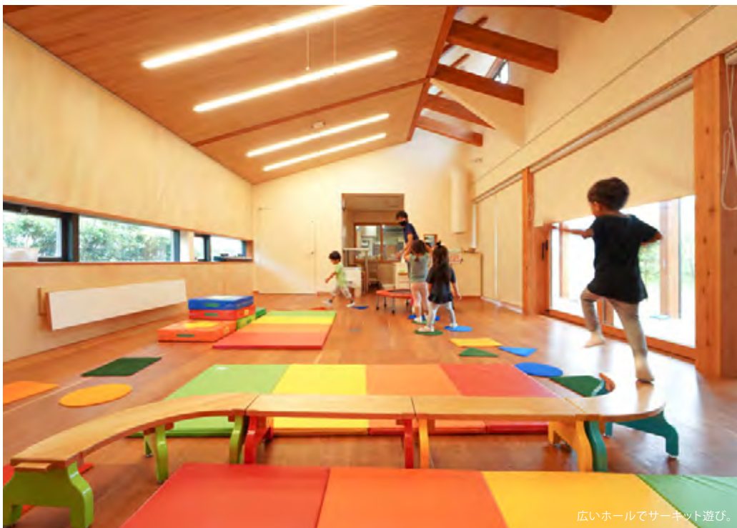
広いホールでサーキット遊び。