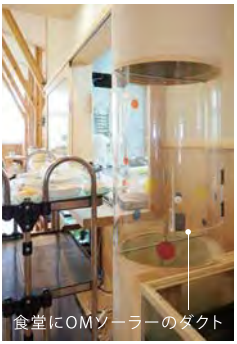
食堂にOMゾーラーのダクト