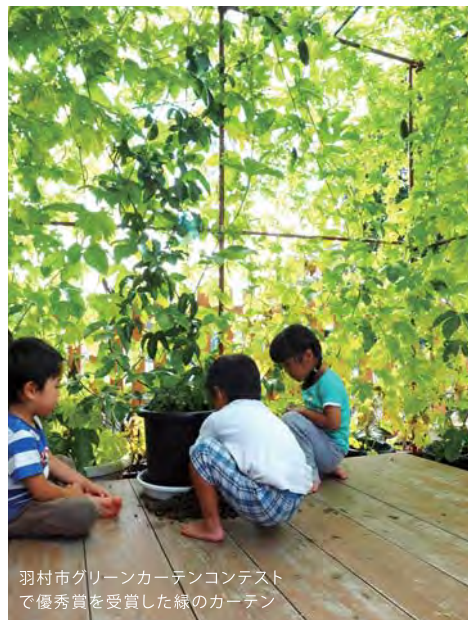
羽村市グリーンカーテンコンテスト で優秀賞を受賞した緑のカーテン