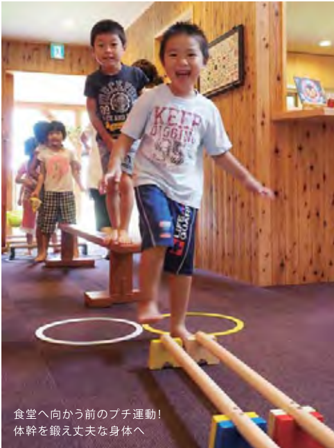
食堂へ向かう前のプチ運動! 体幹を鍛え丈夫な身体へ