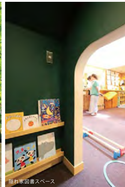
隠れ家図書スペース