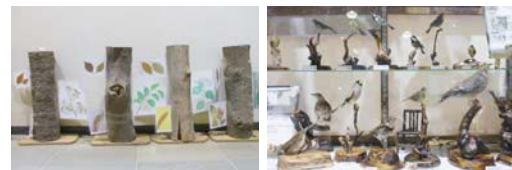
狭山丘陵に生息する植物や動物たちも展示されています!