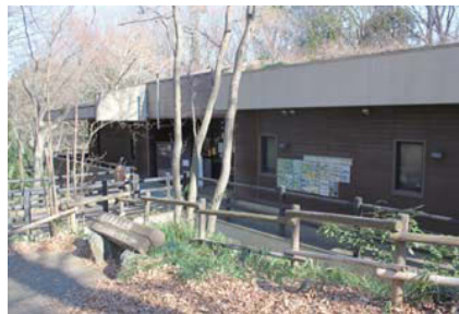
所在地:埼玉県所沢市荒幡782 営業時間:9:00~17:00 ④月曜 ☎(04)2939-9412

荒幡富士の近くにある、狭山丘陵がまるごとわかる学習センター!身近な自然とのふれあいを通じ、自然の大切さや人との関わりを学べます。「3月15・29日の土曜日には里山管理体験や大人のための自然観察会のイベントが開催予定。詳しくはお電話にてお問い合わせください。