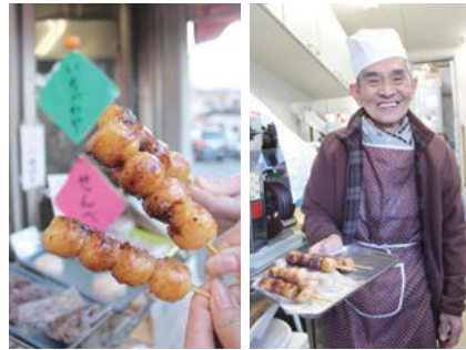
住所:埼玉県所沢市金山町13-12...西所沢駅から501m 営業:8:30~18:45 ④水曜・祝日 ☎(04)2922-2979

お米屋さんを選びすぐったお米を使ったおじいちゃん自慢の一本。醤油の香ばしさがたまらない素朴で懐かしい味わい。街歩きのお供に!一本70円。土日は一本50円! (サービスデー)