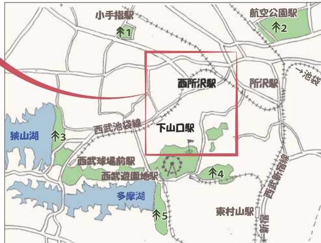
↑公園 1北野公園 2航空公園 3県立狭山自然公園 4都立八国山緑地 5都立狭山公園