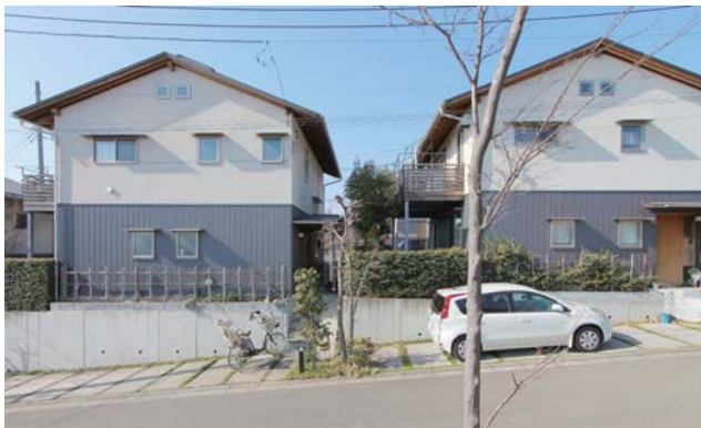
ゆるやかな坂道が心地よい街並み/ソーラータウン西所沢