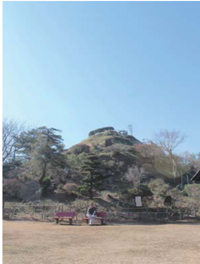
所在地:埼玉県所沢市荒幡748 ④なし *入場自由

旧荒幡村の浅間神社と4つの神社を共にまつり、村人と近隣有志たちが15年の歳月をかけ、明治32年に完成した富士塚。高さ10mの頂上では、360度のパノラマが広がり、天気良ければホントの富士山や、スカイツリーも見えます!