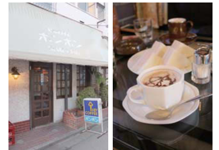
住所:埼玉県所沢市西所沢1-16-16...西所沢駅から200m 営業時間:8:30~22:00 ④日曜日 ☎(04)2924-0214