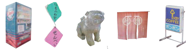
街中を歩くとちよっぴり懐かしい風景も♪

「にしとこ」とは埼玉県の西所沢駅周辺のエリアの愛称。西武線沿線のなかでも大きな町のひとつで、所沢駅より西武池袋線でひと駅です。駅周辺はおおきなマンションも建ち並び新しい街並みも。所沢駅までも散策できるのがたのしい。駅をすぎしばらく行くと、あたりはとてものどか。畑が広がり小鳥のさえずりがよく響く懐かしい風景が続いています。そしてここは狭山丘陵のおひざもと。周辺には保護された緑地や公園も多く、お手軽なハイキングも楽しめますよ。